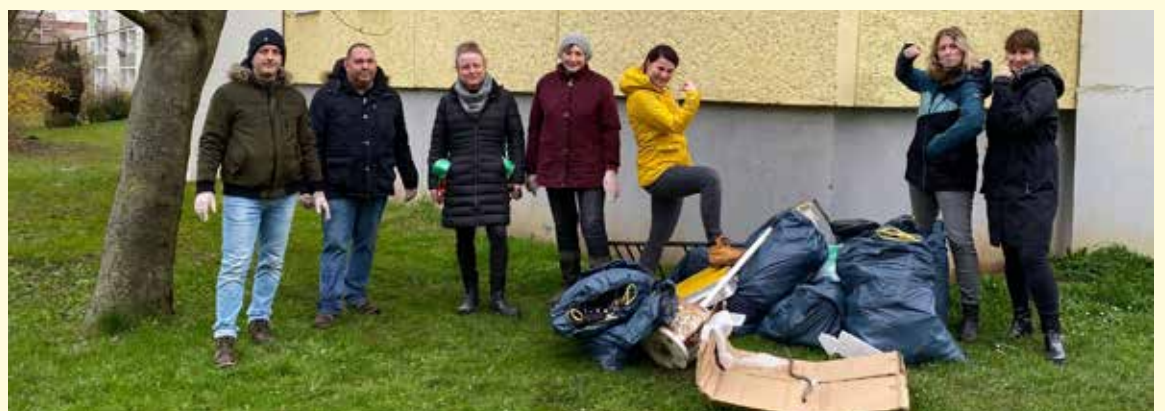
„Reichlich Müll wurde durch die freiwilligen Helfer in Bieblach aufgestöbert und entsorgt.“