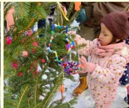
„Kinder der Kita Mosaik lauschen dem Gesang des Männerchores des Handwerks und schmückten zum Adventssingen den Baum mit selbst gebasteltem Schmuck“

Am 08.12.2022 fand unser diesjähriges Weihnachtskonzert statt.