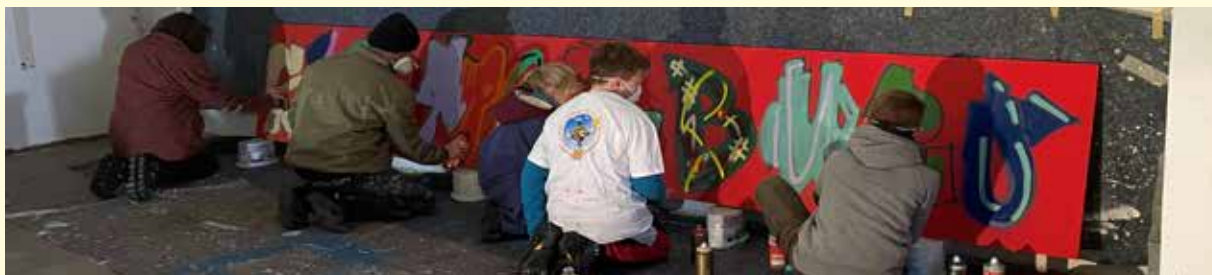
„Kinder des Stadtteils beim Bemalen der Graffitiwand“

Am 14. Dezember trafen sich Jugendliche aus Bieblach und Umgebung zur Erstellung eines Graffitis für das dort ansässige Stadtteilbüro, um den neuen Standort der Büros noch mehr in den Focus der Bieblacher Bürger zu rücken. sieben Jugendliche konnten zur Umsetzung des Projektes gewonnen werden. In Kooperation mit dem Graffiti-Künstler Thomas Prochnow aus Gera wurde das Logo des Stadtteilbüros auf eine 5mx1m große Platte aufgebracht, wobei die Jugendlichen bei der Gestaltung freie Hand hatten. Angesichts der enormen Herausforderung bei der Integration von MigrantInnen und des spürbar sinkenden Zusammenhaltes in der Gesellschaft konnte das Graffiti-Projekt Öffnungsprozesse initiieren, unterstützen u. begleiten. Durch gemeinsames ehrenamtliches Engagement von Menschen mit und ohne Migrationshintergrund des Stadtteiles Bieblach wurden so Vorurteile abgebaut und das Verständnis füreinander wuchs.